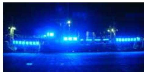
写真 LED 点灯の様子

日本海の沖合域で操業する中型イカ釣り漁船は、韓国漁船との漁場競合による影響に加え、最近の急激な燃油高騰の影響により、経営状況は急速に悪化している。このため、イカ釣り漁業の経営改善に大きく貢献するものと期待されている青色発光ダイオード集魚灯（以下青色 LED）の普及に向けて、漁獲試験について平成 17～19 年の 3 ヶ年調査を実施した。