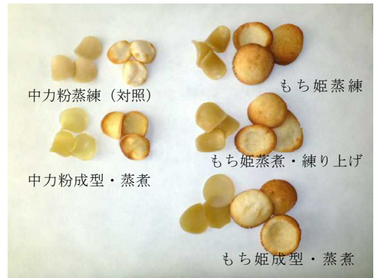
図1 焼成後の煎餅生地膨化率 (平成24年 青森農加研)