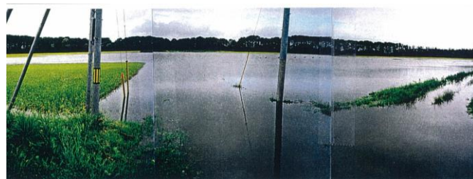
水田等の湛水状況

本地区は、東北町の小川原湖沿いの低平地に位置していることから、降雨のたびに水田や周辺の住宅地が浸水に悩まされてきました。このため、排水機場の改修（県営花切地区湛水防除事業：H9～13）を実施し、現在は幹線排水路の整備（県営上北地区農村振興総合整備事業：H19～24）に取り組んでいます。