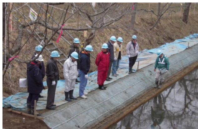
協議会による現地検討会の様子

また、水路沿いには「湖畔千本桜」と呼ばれる桜並木や散策道があり、地域住民が景観を楽しむコースとなっていることから、転落防止柵には地域資源である間伐材を利用しました。