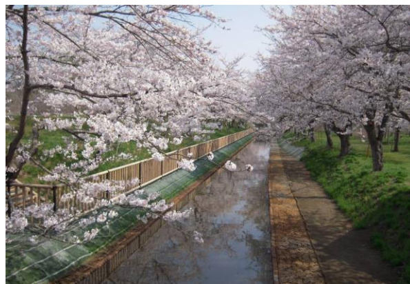
整備後の南谷地幹線排水路と湖畔千本桜

水路整備は平成24年度に完了する予定ですが、協議会では、それ以降も生き物調査や草刈りなどを継続し、施設の維持管理を地域自らが行っていくこととしています。