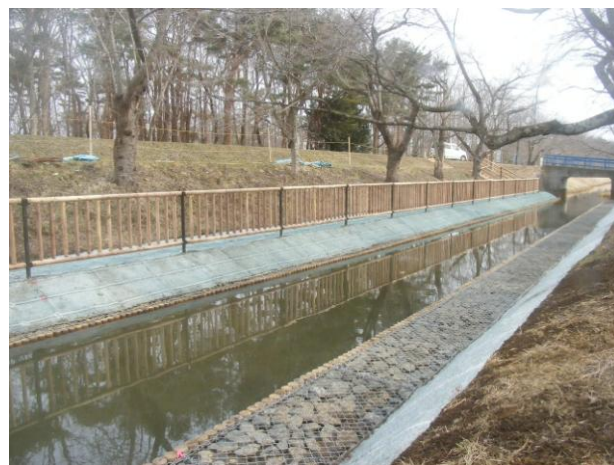
生態系に優しいカゴマット工法

そこで、魚類の隠れ家となる隙間を確保し、生態系を守る水路の工法として、金網のカゴに石を詰めた「カゴマット」が使われました。