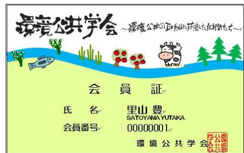
環境公共学会の会員証

入会した方々には会員証を発行しています。ぜひ皆さんも環境公共に取り組む“仲間”に加わりませんか。