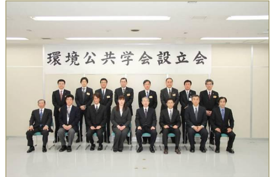
世永会長(前列左から4人目)ほか設立メンバー

本学会は、各地域で環境公共に取り組む地区環境公共推進協議会からの“お互いの活動の連携を深めたい”、“他地区での活動状況を知りたい”などといった要望を踏まえて設立に至ったもので、取組の環（わ）をさらに広げながら、安全・安心で優れた農林水産物を生産する農山漁村を将来へ引き継いでいくことなどを目指します。