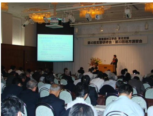
講演を聞く参加者