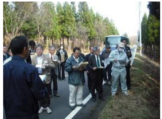
森林整備（間伐）の状況を視察