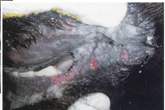
口唇部のびらん（黒毛和種）