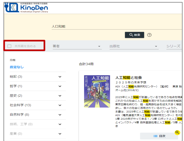
所蔵タイトルのみ