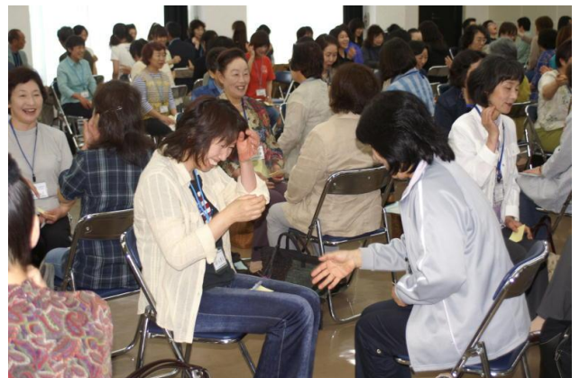
ゲームを通し、子どものあそびを考えました