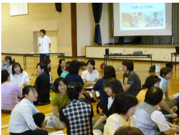
和やかに情報交換