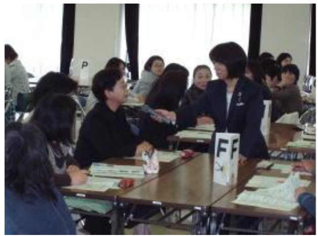
参加者へのインタビュー