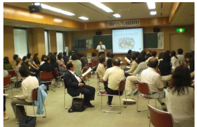
講義と演習によるコミュニケーションスキルのアップ