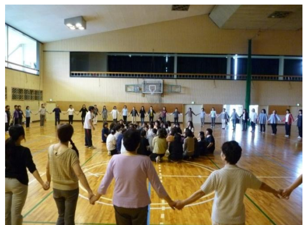
子どもたちは遊びが大好き