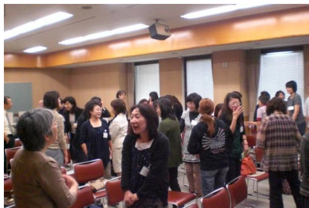
アイスブレイクで雰囲気づくり