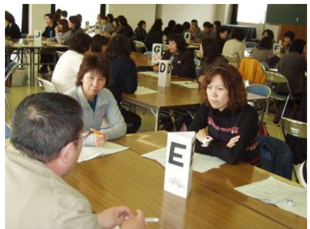
バズセッションの様子