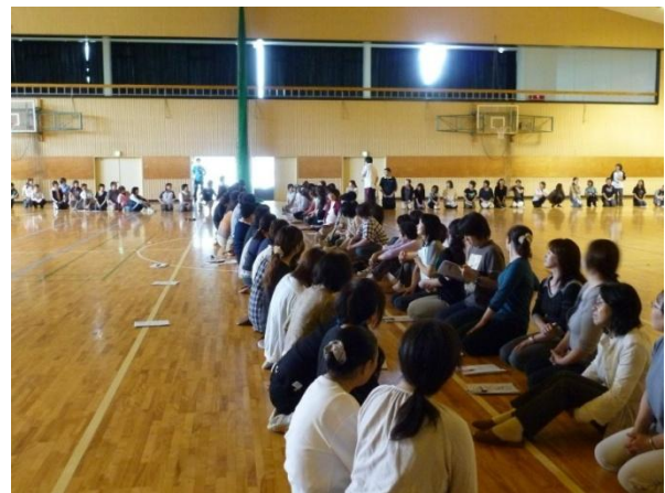
講義と実技を組み合わせた研修会