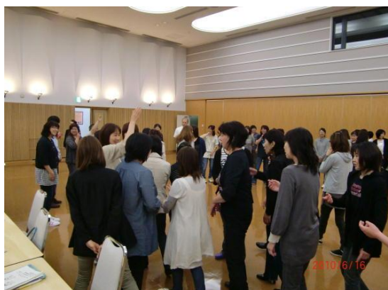
遊びを取り入れたグループ分け