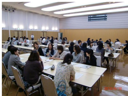
グループワーク・情報交換