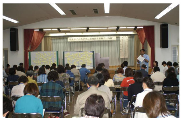
講師の先生からまとめのお話