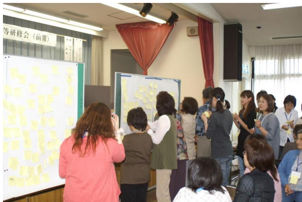
考えを付箋紙で発表しました