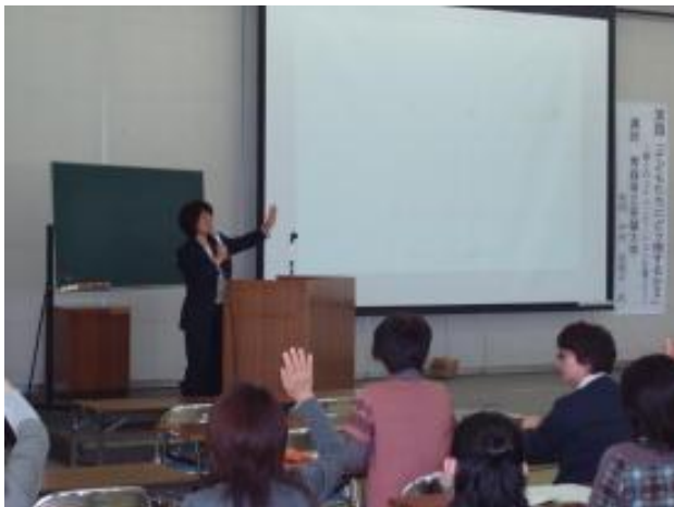
聴く人がどんどん引き込まれる講演