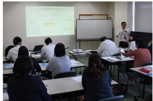
演習「主体的・対話的で深い学びの授業づくり」 特別支援部会

受講者の所感からは、「やる気が出てきました。早速来週から作成にとりかかりたいと思います。」「具体例が多く、分かりやすかったです。」など満足度の高い評価となっていました。