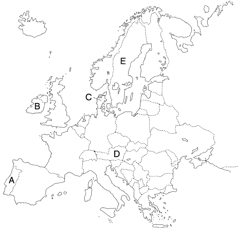
〔アルベルス正積円錐図法による世界地図の一部〕

(4) 次のa～dのグラフは、我が国とある欧州連合〔EU〕の加盟国との貿易を示している。あてはまる国名を下のア～エから1つずつ選び、その記号を書きなさい。