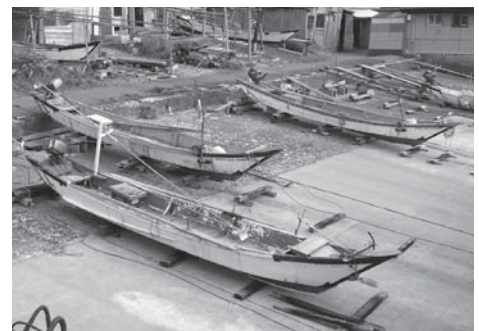
写真1 磯舟（今別町褰月）

船の前部をオモテ、中央部をドノマ、後部をトモといった。イソマワリの作業はオモテの右舷側から身を乗り出し作業した。作業する側の右舷をマエフネ、反対の左舷をウシロフネという。推進具はクルマガイと帆を使用した。イソマワリを一人で行うときには右舷から身を乗り出し、右手でホコをもちガラス（箱メガネ）を口で固定し、左舷のクルマガイは左手、右舷のクルマガイは右足で漕いで船を微妙に移動させた。この技術は難しいもので、褰月の人が一番うまく、北海道にも伝えたものだ、