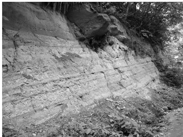
写真1 Loc.1 三戸町城山公園南側