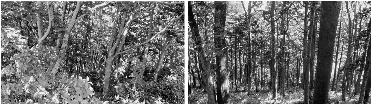
図1. 調査地概略図, 写真1. 調査地(野辺地町烏帽子岳) 左上下:ブナ林, 右上下:ヒバ林

この方法に従ってまず全体(16地点)を分析すると、M群21%、G群55%、P群24%となり、典型的な森林型であった。次に時期別にみると、6月(8地点)はM群19%、G群58%、P群22%となり、同様に森林型であったが、7月(8地点)ではM群42%、G群42%、P群16%となり森林型を示さず、類型的には高山型となった。さらに植生別にみると、ブナ林(8地点)ではM群19%、G群53%、P群28%で同様に森林型に、ヒバ林(8地点)ではM群21%、G群62%、P群6%で、これも森林型といえよう。しかし、基礎となるべき種理数・個体数が少なく前回同様とはいえず、7月の調査から得られた個体数の少なさに問題があったと思われる。