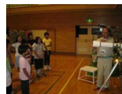
(視聴覚センターによる星座観察)

校内支援委員会は全教職員6名で組織した。学校支援委員会は、校内支援委員会に加えPTA協力者、地区協力者、県・市教育委員会担当指導主事で組織した。それぞれの活動について主担当者が企画し、校内支援委員会で実施方法等について協議した。その後、地区協力者を直接訪問することにより、共通理解や連携がスムーズに行われ、実施する際の注意点やアドバイスを頂くことができた。また、県生涯学習課より青森での宿泊施設の情報提供、各種体験活動の講師の紹介をして頂き、校内委員会で体験施設・宿泊施設を下見し、担当者と打ち合わせをすることができた。