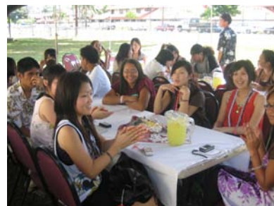
(現地高校生との交流会)