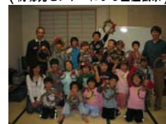
(物づくり体験クリスマスリース)