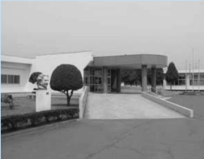
青森県立 青森第一高等養護学校