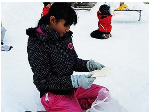
<アイスのできあがり>