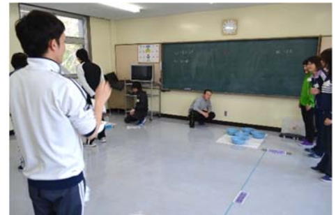
<洗面器松ぼっくり投げ>