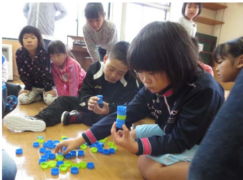
<キャップ積みバランス>