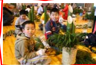
丁寧に、スギを差していきます。