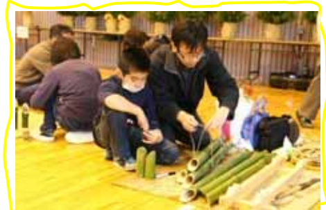
切り終わったら、再びしっかり縛ります。