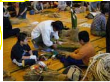
慎重に長さを決めます。