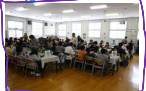
昨年に引き続き、お昼ご飯は大好評でした。