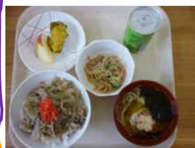
オリジナルメニューのしょうが味噌牛丼 ボリュームも満点です。