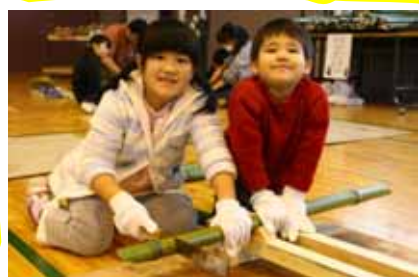
協力して竹を切ります。