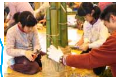
スギを差しやすいように、段をつけます。