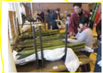
好みの太さの竹を選びます。