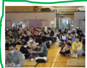
今回は134名が参加しました。