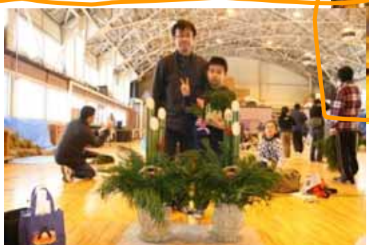
立派な門松の完成です。