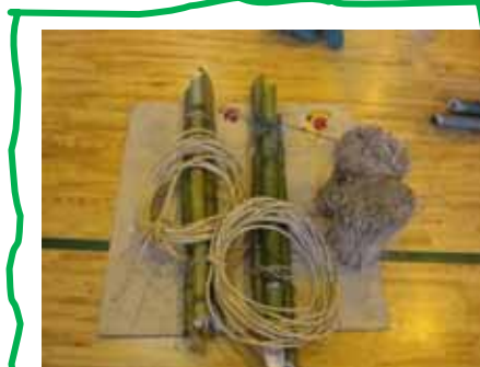
土台作り用の竹・わら等