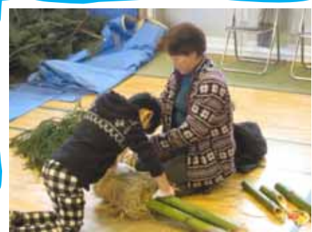
力を込めて縄を巻いていきます。