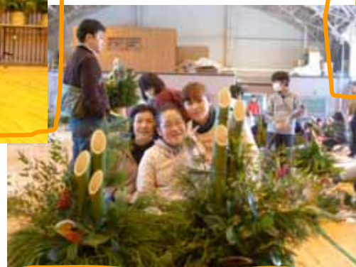
持参した常緑樹をつけると華やかな門松になりますね。