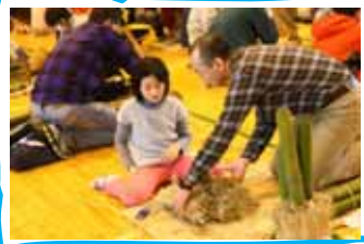
バラバラにならないよう注意します。