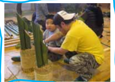
もうすぐ土台が完成しますね。