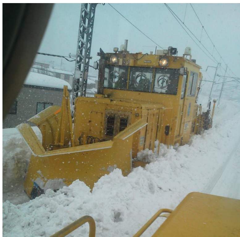
除排雪作業（筒井駅構内）