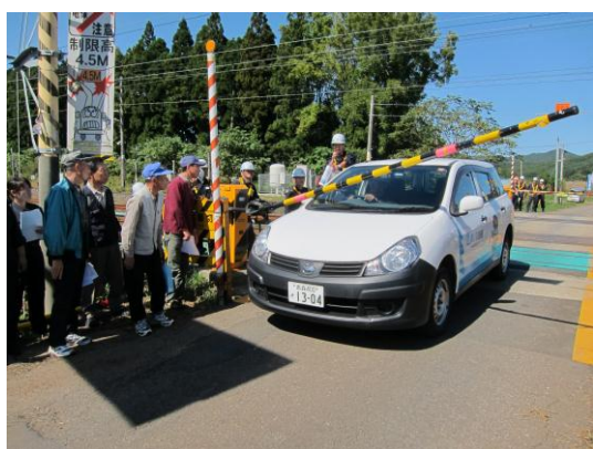
踏切事故防止訓練会（脱出訓練）

日本貨物鉄道(株)東北支社が主催した訓練に参加し、盛岡貨物ターミナル駅を会場に、機関車脱線の復旧等について訓練しました。（平成26年9月12日）