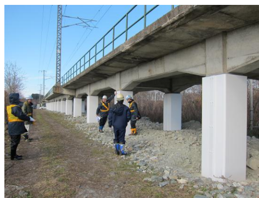
鉄道施設保守作業（耐震補強）