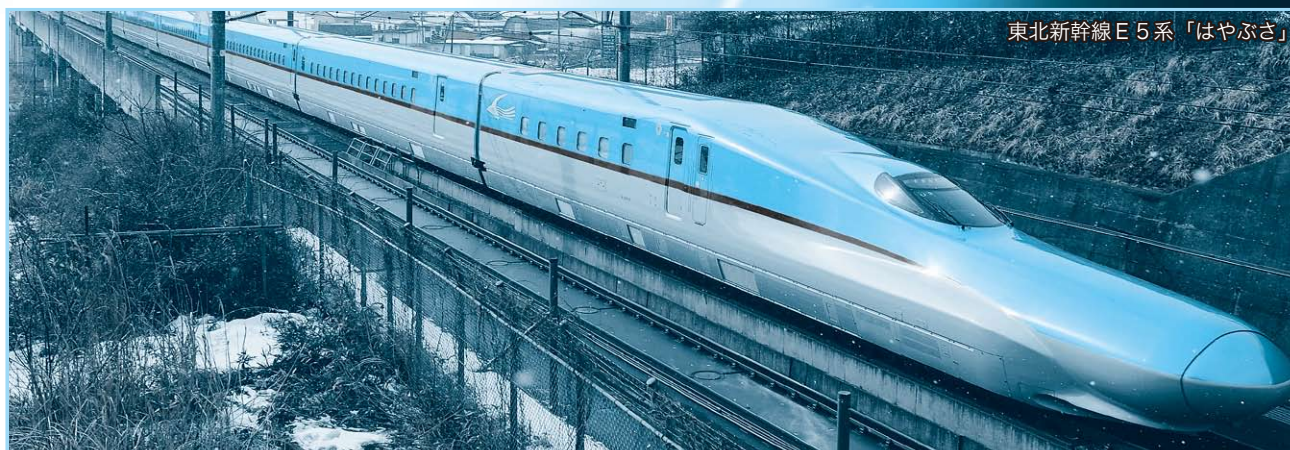
東北新幹線E5系「はやぶさ」