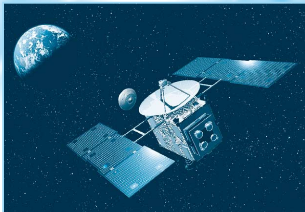
小惑星探査機「はやぶさ」 イラスト：池下章裕