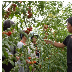
トマト収穫体験の様子