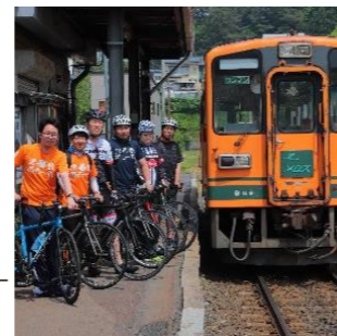
津鉄×サイクリングで誘客促進に取り組む様子