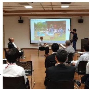
住民や関係者による勉強会