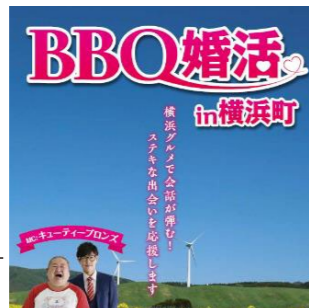
横浜グルメで楽しむBBQ婚活