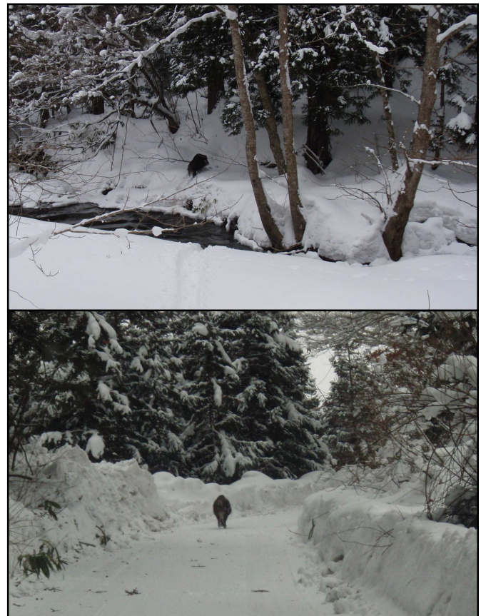
五所川原市金木町で目撃されたイノシシ