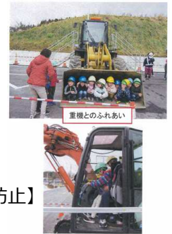
【子供たちの現場見学会】