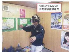
【VR技術を活用した安全管理】