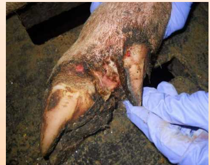
蹄球部皮膚のびらん