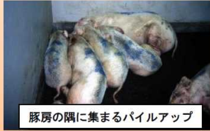
豚房の隅に集まるパイルアップ