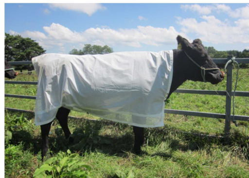
↑ アブジャケットを着用した牛