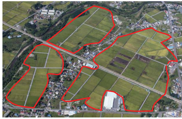
【整備後】荒川中部地区（青森市）

基盤整備を契機として、担い手の経営する農地が集積・集約化され、効率的な営農が実現されます。