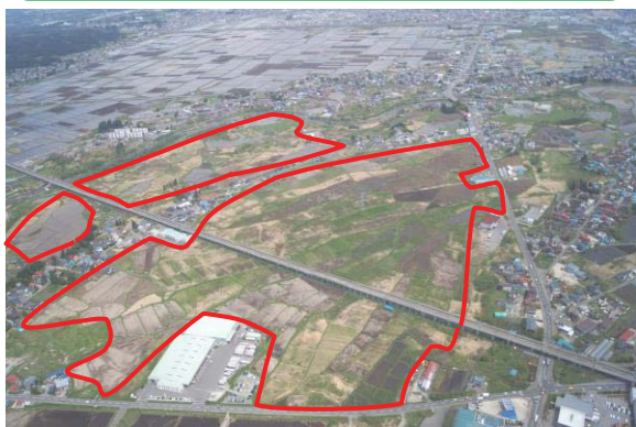
【整備前】荒川中部地区（青森市）

担い手の経営（所有・貸借・作業受託）する農地が分散しており、非効率的な営農を強いられています。