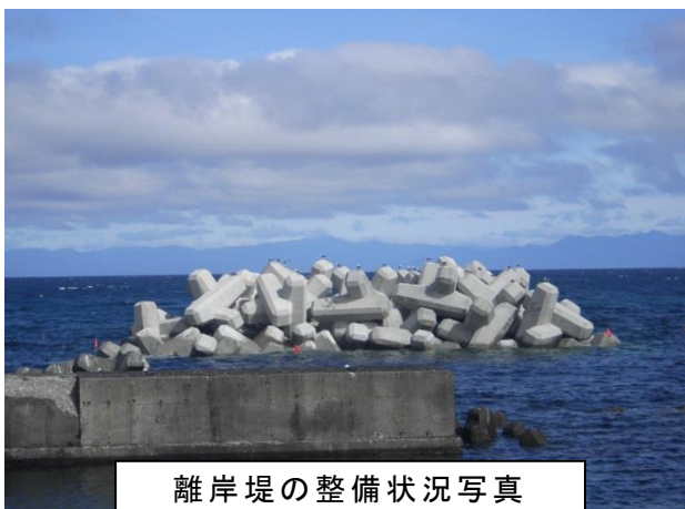
離岸堤の整備状況写真