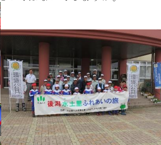
旅の開始前に記念撮影