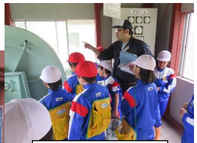
頭首工の施設説明