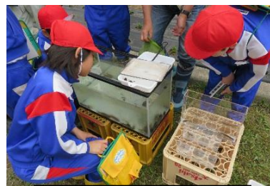
ため池の生き物観察