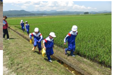
白熱したアヒルレース