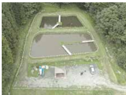
ビオトープ池全景

協議会では間伐材を利用して木橋や転落防止柵の設置等の活動を実施したほか、令和5年度には地元の児童生徒らを対象とした釣り大会を開催し、子どもたちが自然に触れ合う場を提供しています。