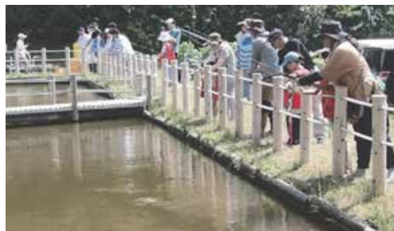
令和5年度の釣り大会の様子