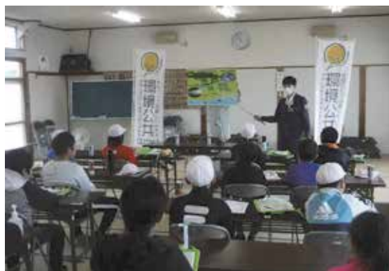
ふるさと水土里ふれあいの旅 2023 の様子