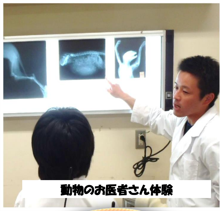
動物のお医者さん体験

日本でも有数の食料生産県である青森県では、 食品衛生・家畜衛生分野の両方で獣医師が幅広く活躍しています！