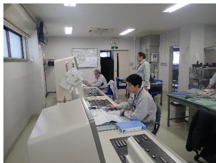
青森空港での航空灯火監視状況

価値ある県有施設を次世代に継承するため、施設の効率的利用や長寿命化の推進など、施設を経営的視点から最適な状態で管理・運営する手法である FM を実践しており、青森県の FM は全国唯一です。