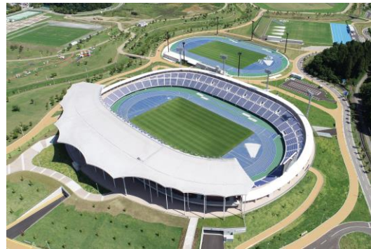
新青森県総合運動公園陸上競技場 （平成 30 年竣工）