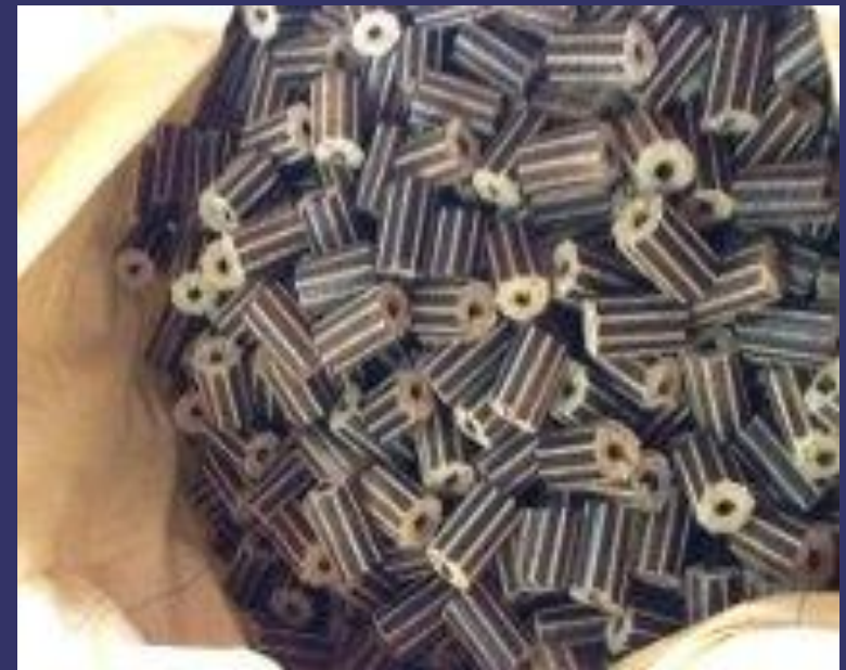
野外パーティー用 向け