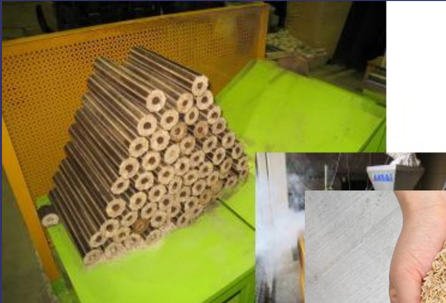
ほっかほっかくん