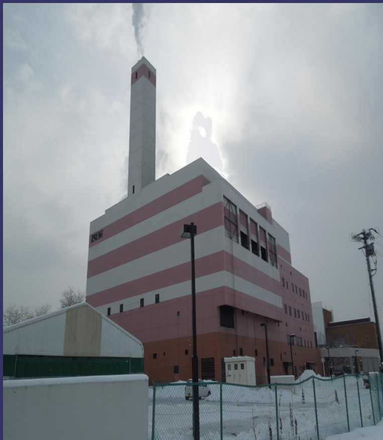
プラント会社 JFAが実験 (旧日本鋼管)