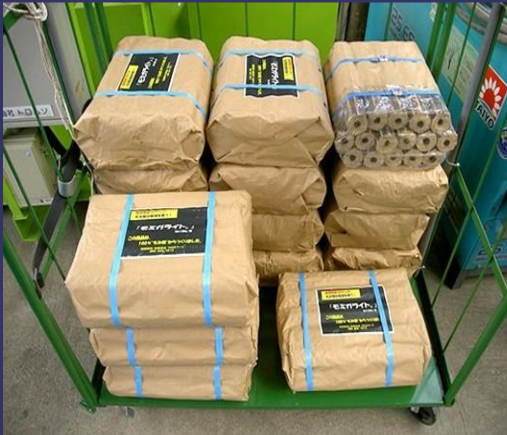
ホームセンター向け