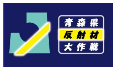
青森県反射材大作戦ロゴマーク