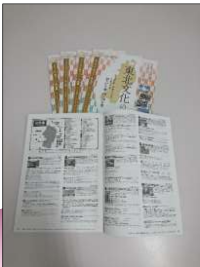
平成29年度ガイドブック

○東北6県と仙台市に配布する「東北文化の日」ガイドブックに、施設・イベント情報が掲載されます。