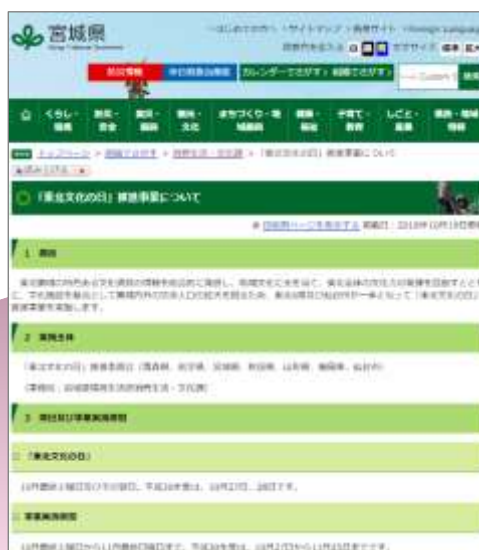
例：宮城県公式ウェブサイト

https://www.pref.miyagi.jp/soshiki/syoubun/tohokubunka-2019.html