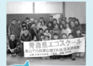
白神の大自然を満喫しましたよ~