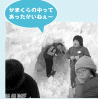
かまくらの中であつたかいねえ~

を教えてもらいすぐにスイスイ歩いていました。ちょうど3時のおやつ時間になったところで今度は餅つき体験。ちょっと重いきねにてこずりなが