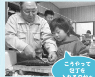
こうやって包丁を入れるのさ