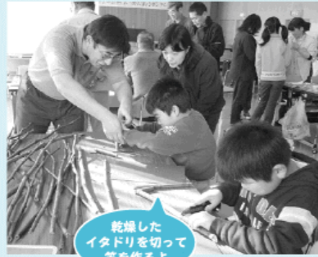
乾燥したイタドリを切って笛を作るよ

イタドリという草を使った笛作りでは「草って乾燥させると硬いんだなって思いました。自分で作った笛が鳴った時は嬉しかった」とにっこり。