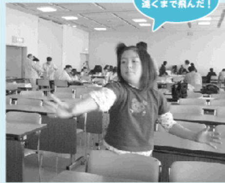
紙で作った輪が、遠くまで飛んだ!

この他、紙で輪や木の種の形を作って飛ばしたり、電子レンジで押し花を作るなど、参加した人たちは目を輝かせて取り組み、身近な素材を使って自然科学を楽しく理解しました。