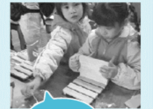
木工クラフトに真剣そのもの...

で暮らす人々の温かさに触れることができました。環境保護の気持ちは、大自然の中でこそ育まれ、実感できるものではないでしょうか。