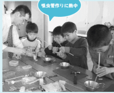
吸虫管作りに熱中

遊びを通し豊かな自然を体で感じようと、自然科学の祭典が行なわれました。会場には様々な実験ブースが設けられ、吸虫管のコーナーではフィルムケースとストローを使い、小さな虫を傷つけないで捕まえる道具を作製。子どもたちは「吸って虫を捕まえるなんておもしろい」と大喜び。