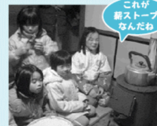
これが新ストーブなんだわ

らも、合計4升のお餅をつきあげ、あんどきな粉で美味しく食べました。その間にも、かまくらやすべり台をつくって楽しみました。