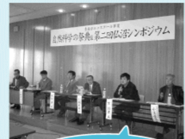
仏沼のラムサール条約登録を願い、活発な意見交換が行なわれたパネルディスカッション

人間が貴重な自然と共生するには、もっともっと地域住民を巻き込んでその大切さを認識し、環境を守っていくことが必要ではないか、と考えさせられた1日でした。