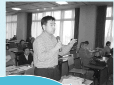
「仏沼の貴重だけでなく、生き物のおもしろさも伝えたいと思う」など、参加者からの意見や質問も続出

当日は晴天。朝、青森駅前に集合し大型バス2台で、鱈ヶ沢町にある白神自然学校一ツ森校まで約2時間半の移動です。当日の朝、神奈川県鎌倉市から来た小学生の兄弟2人も合流し、バス内では自己紹介や環境に関する簡単なクイズなども行われました。