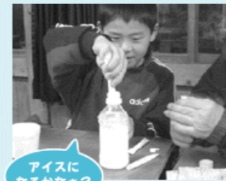
アイスになるかな?