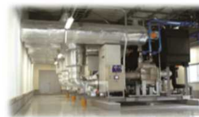
<中央方式冷凍冷蔵機器>

フロン類ではなく、アンモニア、二酸化炭素、空気等、自然界に存在する物質を冷媒として使用した冷凍冷蔵機器であって、同等の能力を有するフロン類を冷媒として使用した機器と比較してエネルギー起源二酸化炭素の排出が少ないもの