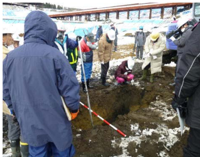
試掘箇所確認状況