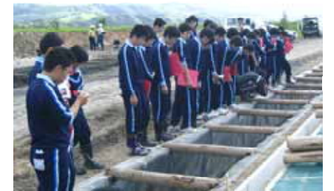
現地見学会の様子