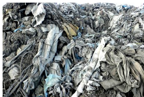
【ビニールなど農業用資材も捨てられています】