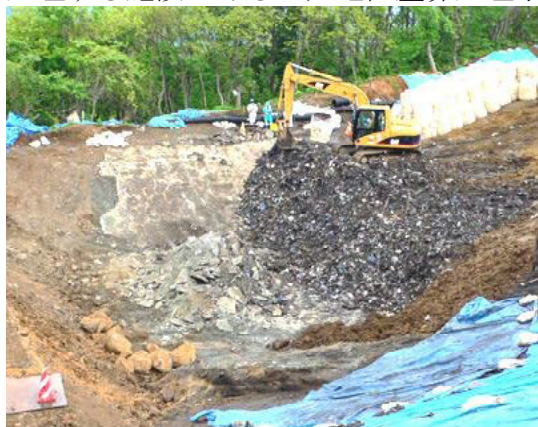
【選別ヤード近くの崖沿いから発見されました】

遮断型処分場に封じ込められていた約1,000トンの一般廃棄物（地中障害廃棄物）については、田子町やその他関係機関等と協議した結果、田子町区域の一般廃棄物を処理する施設である三戸地区塵芥処理事務組合の三戸地区クリーンセンターにおいて処理することとなり、11月1日から撤去を開始しました。