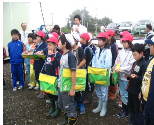
【上郷小（4年）・清水頭小（3・4年）の皆さん】