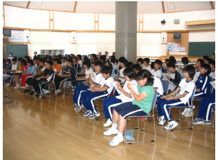
メモを取りながら熱心に授業を聞く田子小学校5・6年生の皆さん【平成18年6月26日】

今後は、9月と10月に小学生を対象とした中間処理施設見学会の開催を予定しています。また、9月9日（土）に、一般町民の方々を対象とした不法投棄現場見学会の開催を予定しています（下記のお知らせをご覧ください。）。