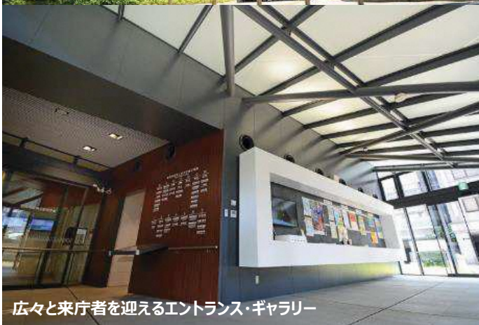
広々と来庁者を迎えるエントランス・ギャラリー

空調面積 158㎡ (エントランス・ギャラリー・トイレ・授乳室) ヒートポンプ GSHP-3003URF(30kW)×2台 複数台制御装置 GSPC-32×1面 採熱方式 ポアホール方式(シングルUチューブ) 65m×6本 放熱器 シンダー床暖房(暖房)、ファンコイルユニット(冷房)