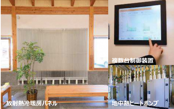
放射熱冷暖房パネル