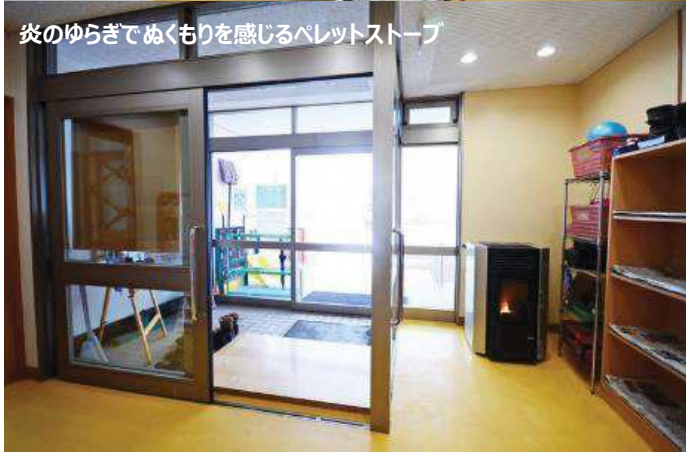
炎のゆらぎでぬくもりを感じるペレットストーブ