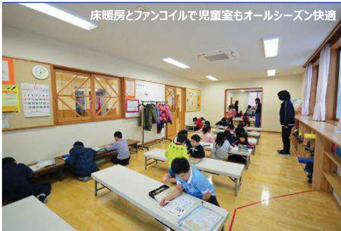
床暖房とファンコイルで児童室もオールシーズン快適