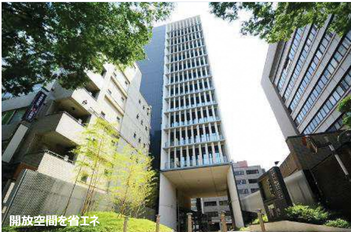
開放空間を省エネ