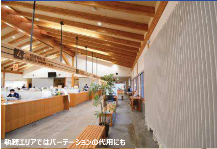
執務エリアではパーテーションの代用にも