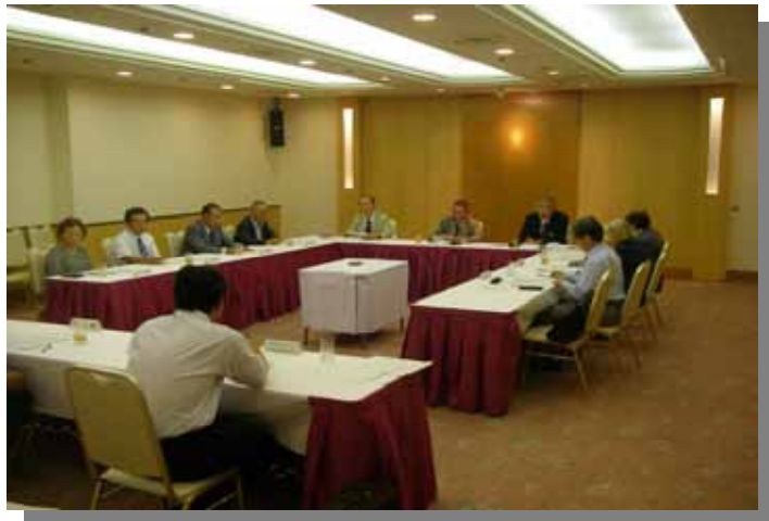
(内水面漁場管理委員会)