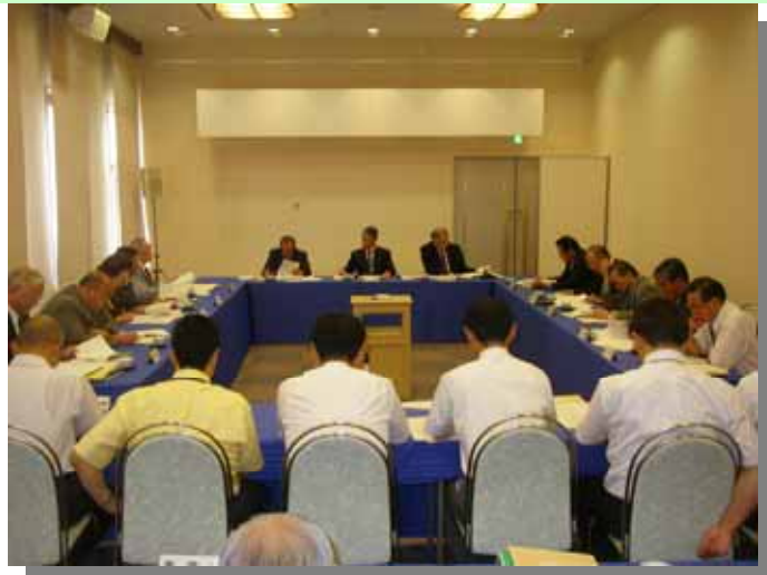
(東部海区漁業調整委員会)