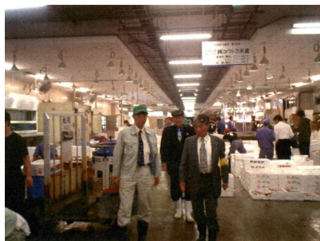
中央卸売市場鮮魚市場