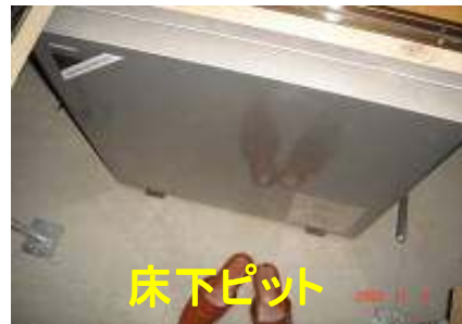
サンポット株式会社資料より